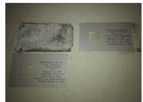
Новые таблички на доме 6 по Гагаринскому переулку

27 декабря – в день гибели Осипа Мандельштама – на месте металлической клычковской таблички появилась картонная. Аналогичную мандельштамовскую закрепили чуть ниже прежней – для демонстрации эстетики современного вандализма.