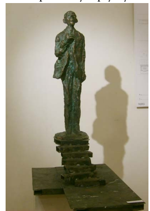
Проект памятника Мандельштаму Л. Гадаева