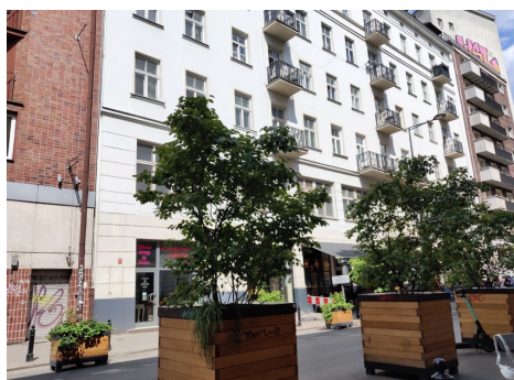
Варшава, улица Згода, 4. Современный вид дома, в котором родился О. Мандельштам.

23 июля 2018 года Анатолий Усанов из города Кувандык Оренбургской области обнаружил на сайте Государственного архива Польши мандельштамовскую метрику. Находка эта внесла важное уточнение в биографию поэта: день его рождения – 14 января, а не 15-го, как полагали раньше. Оригинал документа хранится в фонде 200 («Метрические свидетельства за 1858–1914 годы»). Указанный в нем № 1539 ипотечного договора соответствует дому № 4 по улице Згода. Чудом уцелев в войну, он стоит по сей день. От улицы Осипа Мандельштама на территории кампуса Варшавского университета до него можно дойти пешком за четверть часа.