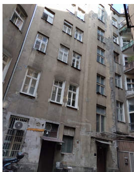
Двор дома 4 по улице Згода.