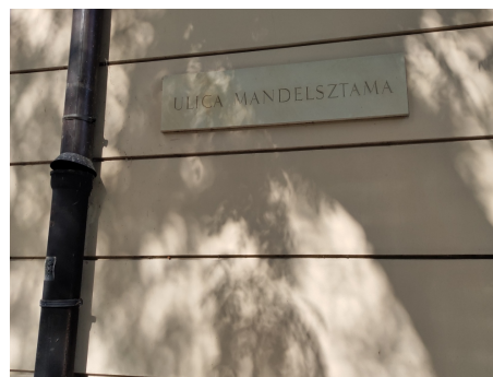
Табличка с названием улицы Мандельштама на территории кампуса Варшавского университета.