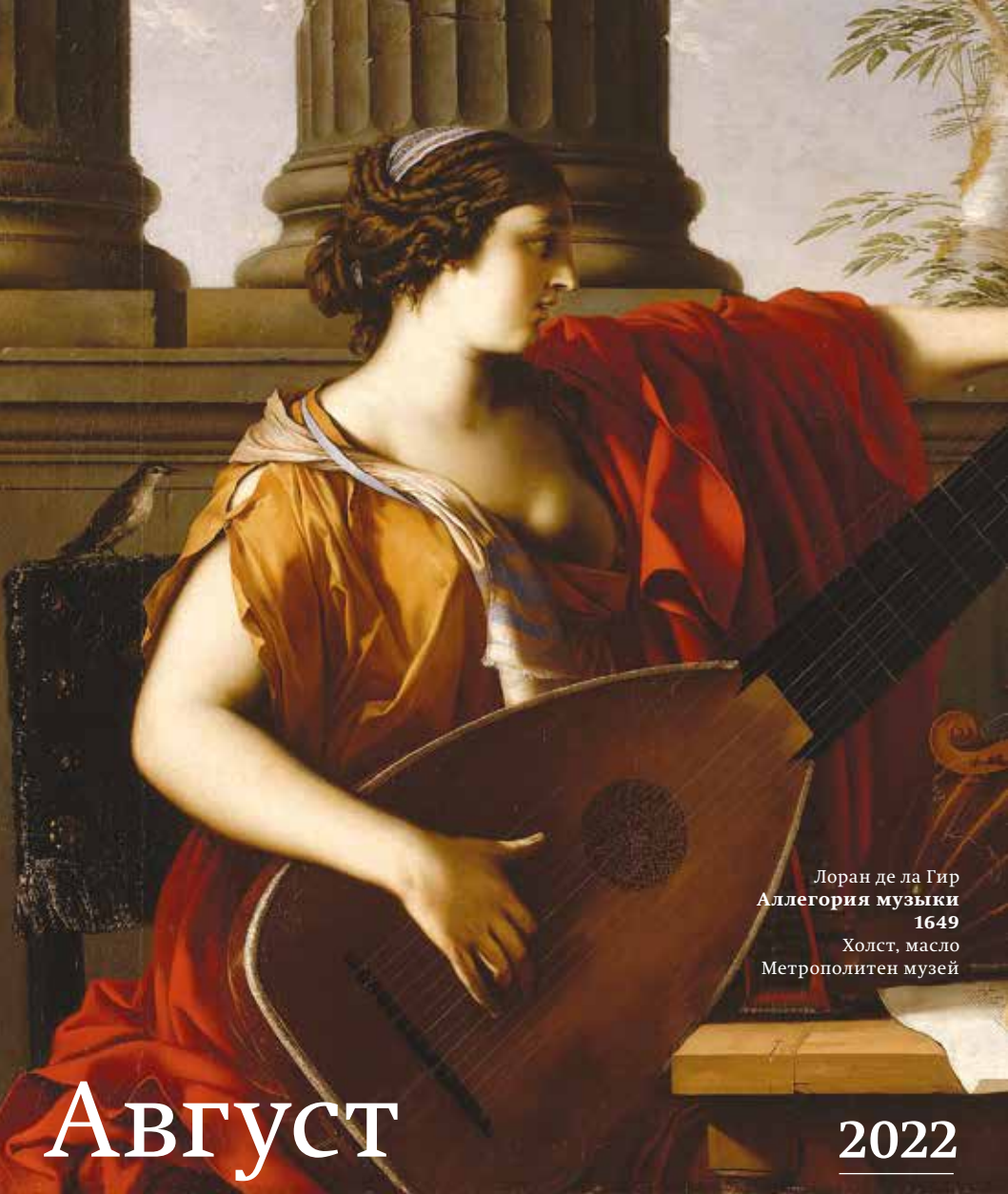
Лоран де ла Гир Аллегория музыки 1649 Холст, масло Метрополитен музей