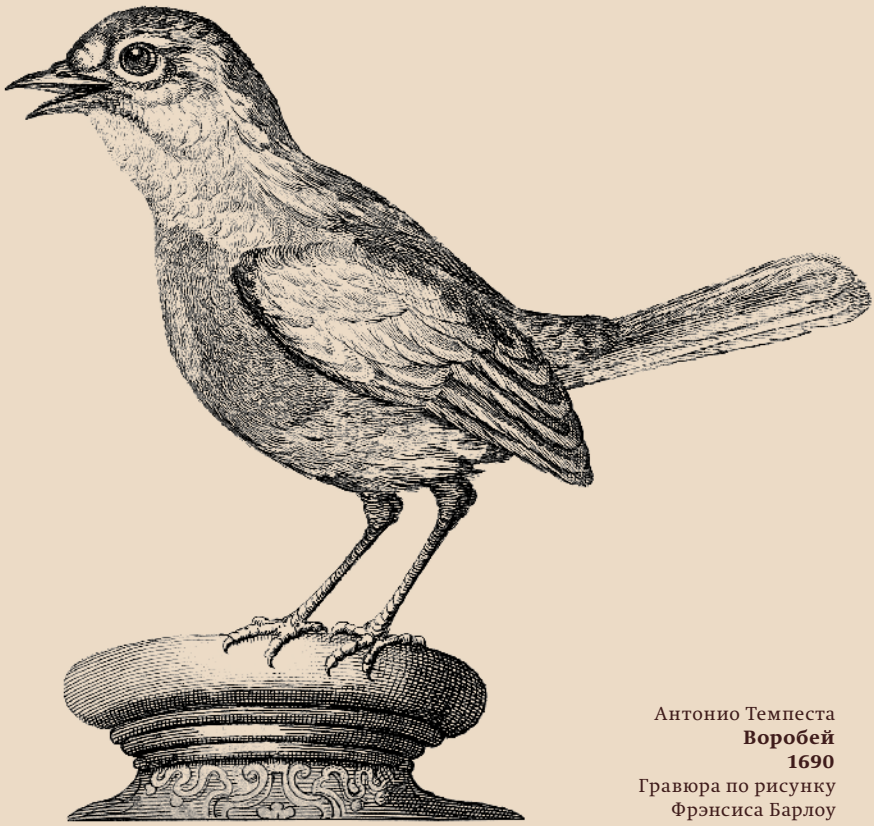
Антонио Темпеста Воробей 1690 Гравюра по рисунку Фрэнсиса Барлоу