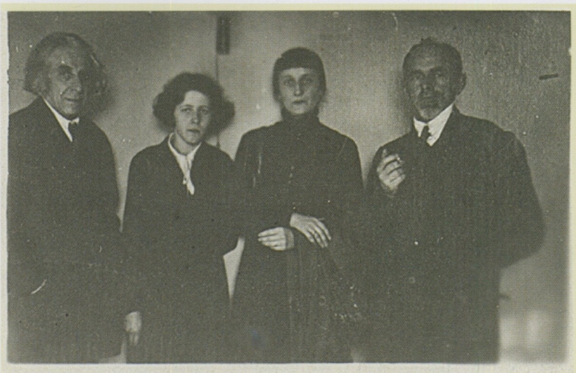
Г.И. Чулков, М.С. Петровых, А.А. Ахматова, О.Э. Мандельштам. Москва, февраль 1934 г.