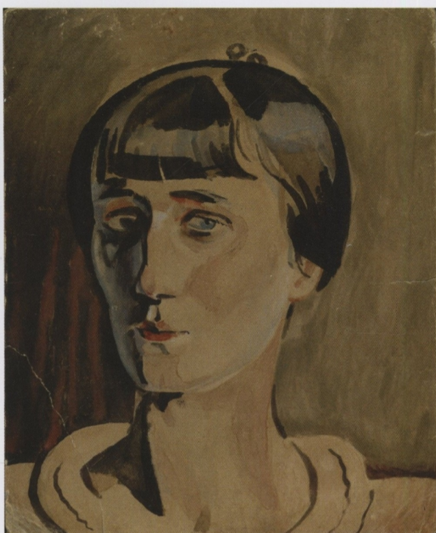
Л.А. Бруни. Портрет Анны Ахматовой. 1922 г.