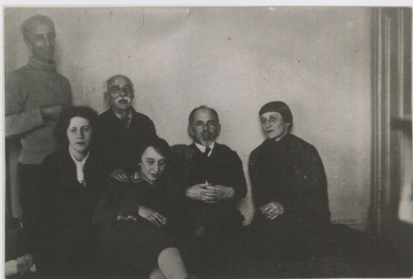
А.Э. Мандельштам, М.С. Петровых, Э.В. Мандельштам, Н.Я. Мандельштам, О.Э. Мандельштам, А.А. Ахматова. Москва, февраль 1934 г.