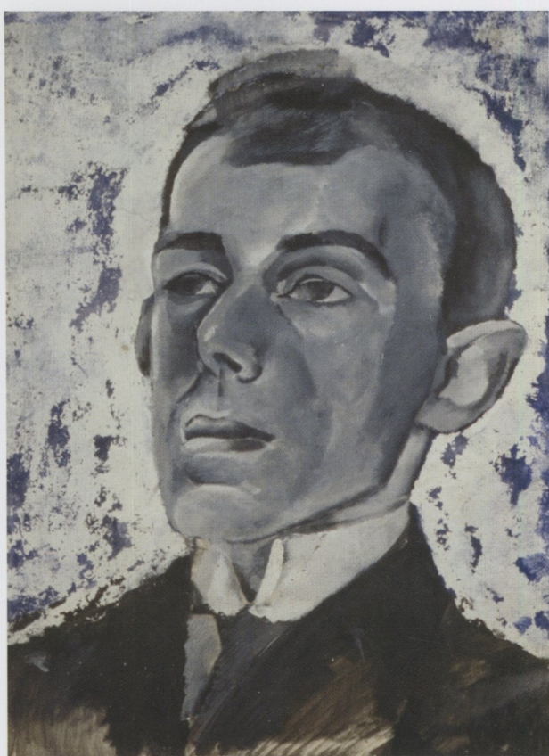
Л.А. Бруни. Портрет Осипа Мандельштама. 1916 г.