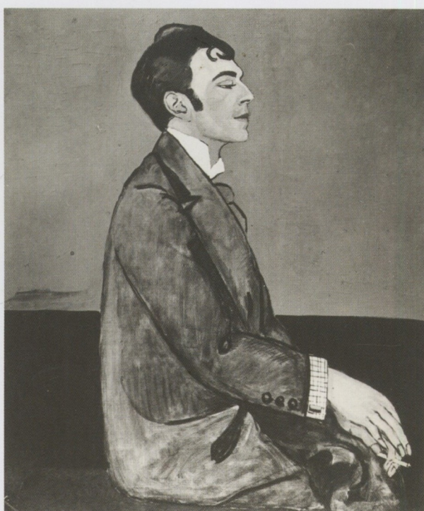
А.М. Зельманова-Чудовская. Портрет Осипа Мандельштама. 1913 г.