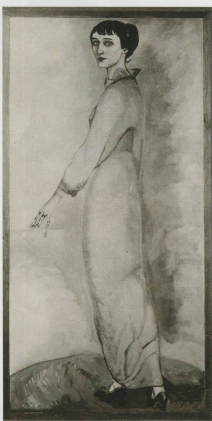
А.М. Зельманова-Чудовская. Портрет Анны Ахматовой. 1913 г.