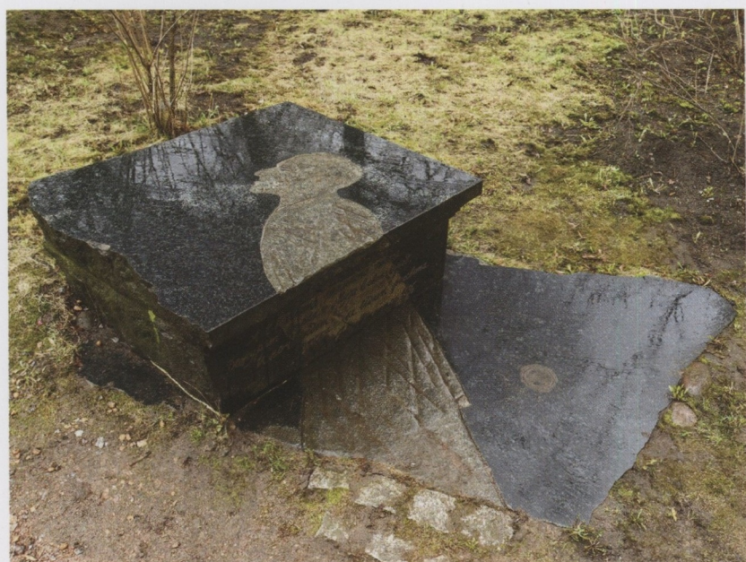
Санкт-Петербург. Памятник О.Э. Мандельштаму, в саду во дворе Фонтанного Дома. Открыт 30 июня 2007 г. Скульптор В.Б. Бухаев.