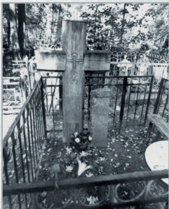
Москва, Старо-Кунцевское кладбище. Кенотаф О.Мандельштаму (ск. Д.Шаховской, гранит). Установлен летом 1985 г. рядом с памятным крестом на могиле Н.Мандельштам.