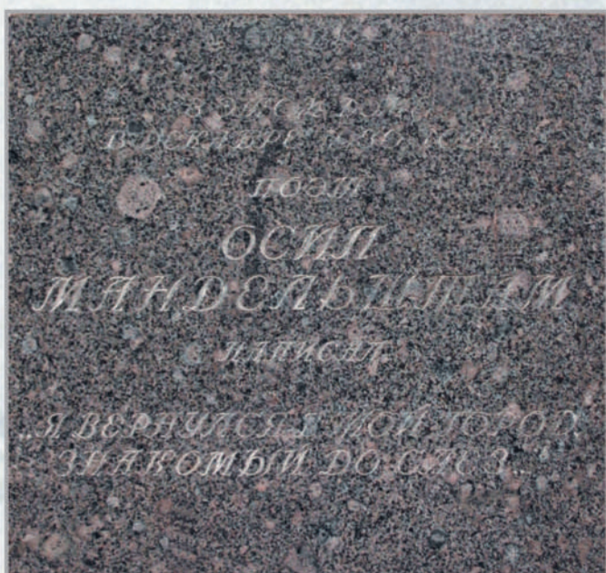
Санкт-Петербург, Васильевский остров, 8-я линия, 31. Мемориальная доска (гранит). Открыта 16 января 1991 г.