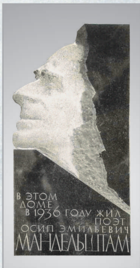
Воронеж, ул. Ф.Энгельса, 13. Мемориальная доска (ск. Л.Эйдлин, габбро-диабаз). Открыта 15 января 1991 г.

На доске малиновой, червонной, На кону горы крутопоклонной, - Втридорога снегом напоенный, Высоко занесся - санный, сонный - Полу-город, полу-берег конный, В сбрую красных углей запряженный, Желтою мастикой утепленный И перегоревший в сахар жженный. Не ищи в нем зимних масел рая, Конькобежного голландского уклона, - Не раскаркается здесь веселая, кривая, Карличья в ушастых шапках стая, - И, меня сравнением не смущая, Срежь рисунок мой, в дорогу крепкую влюбленный, Как сухую, но живую лапку клена Дым уносит, на ходулях убегая.