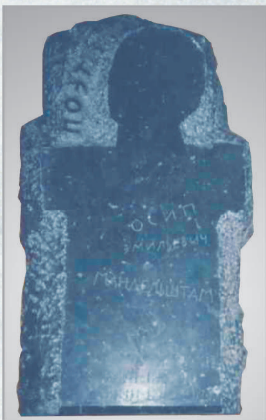
Москва, Тверской бульвар, 25 («Дом Герцена»). Мемориальная доска (ск. Д.Шаховской, гранит). Открыта 15 января 1991 г.