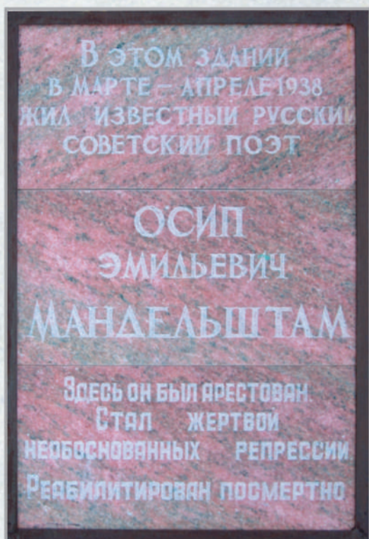
Саматиха, корпус специализированной Шатурской больницы. Мемориальная доска (гранит). Установлена в 1991 г.