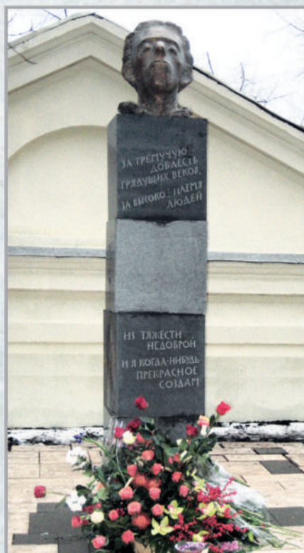
Москва, ул. Забелина, 5. Памятник (ск. Д.Шаховской и Е.Муни). Открыт 26 ноября 2008 г