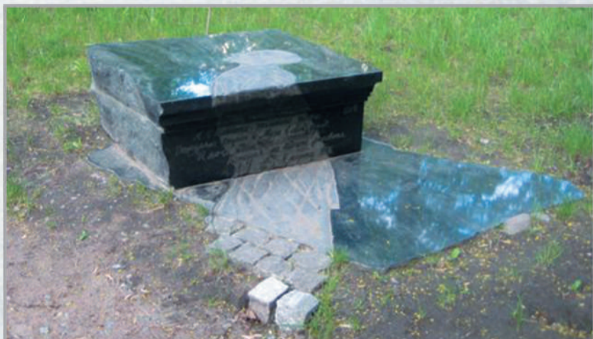
Санкт-Петербург, Литейный пр., 53, во дворе Фонтанного Дома (б. Шереметевского дворца). Памятник (ск. В. Бухаев, габбро) – элемент экспозиции Музея Анны Ахматовой в Фонтанном Доме. Открыт 30 июня 2007 г. к 70-летию Большого террора.