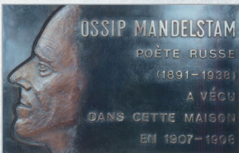
Париж, рю де Сорбонн, 12. Мемориальная доска (ск. Б.Лежен). Открыта 1 февраля 1992 г.