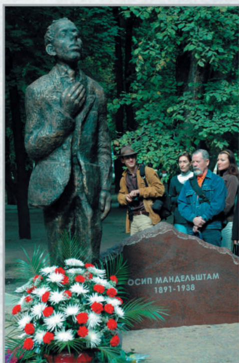
Воронеж, Детский парк «Орленок», угол ул. Ф.Энгельса и Чайковского. Памятник (ск. Л.Гадаев, бронза). Открыт 2 сентября 2008 г.