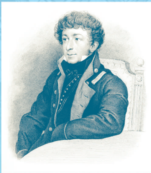
КОНСТАНТИН БАТЮШКОВ (1753-1817) Гравюра И.П.Пожалостина.1883.