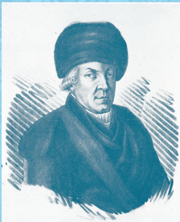
ГАВРИИЛ ДЕРЖАВИН (1743 - 1816) Гравюра Ивана Колосова по оригиналу Сальваторе Тончи. 1801.

Сядь, Державин, развалися, — Ты у нас хитрее лиса, И татарского кумыса Твой початок не прокис.