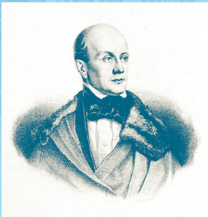
ПЕТР ЧААДАЕВ (1794 - 1856) Гравюра Ксавьера Штайфензанда. Не позднее 1876.

След, оставленный Чаадаевым в сознании русского общества, — такой глубокий и неизгладимый, что невольно возникает вопрос: уж не алмазом ли проведен он по стеклу?