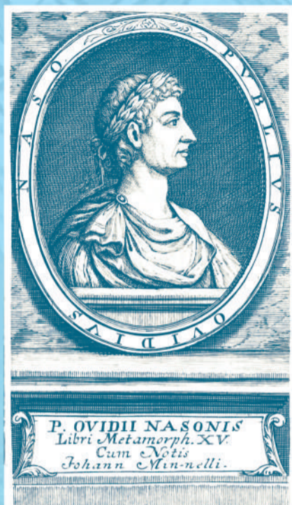
ПУБЛИЙ ОВИДИЙ НАЗОН (43 до н.э. – 17 или 18 н.э.) Гравюра Иоганна-Георга Менцеля. 1677.

О временах простых и грубых Копыта конские твердят, И дворники в тяжелых шубах На деревянных лавках спят.