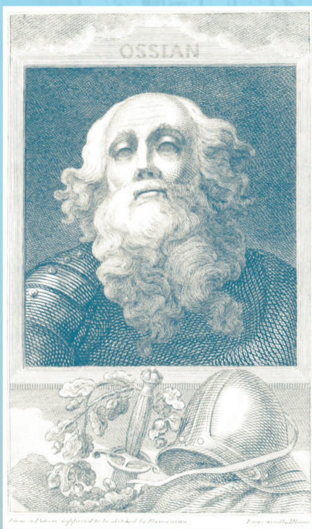
ОССИАН (III в.)

Гравюра Джона Бьюго по оригиналу Александра Рапсимана. Не позднее 1807.