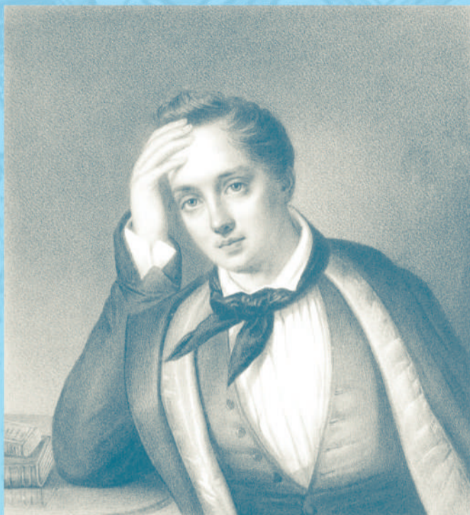
ЕВГЕНИЙ БОРАТЫНСКИЙ (1800 - 1844) Литография Франсуа-Фредерика Шевалье. Вторая половина 1840-х(?).

Дайте Тютчеву стрекозу – Догадайтесь почему! Веневитинову – розу. Ну, а перстень – никому.