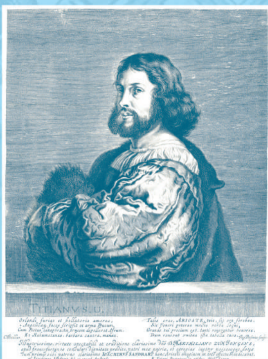
ЛУДОВИКО АРИОСТО (1474 - 1533) Гравюра Ренье ван Персина по оригиналу Тициана Вечелио. 1629-1645.