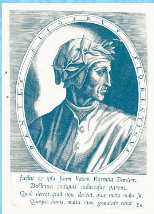
ДАНТЕ АЛИГЬЕРИ (1265 - 1321) Гравюра Филипа Галле по оригиналу Джорджо Вазари. 1572.

Дант – орудийный мастер поэзии, а не изготовитель образов. Он стратег превращений и скрещиваний, и меньше всего он поэт в «общевропейском» и внешнекультурном значении этого слова.