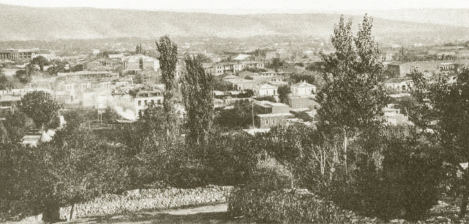
Общий вид города. Начало 1930-х гг.

Ах, ничего я не вижу, и бедное ухо оглохло, Всех-то цветов мне остались лишь сурик да хриплая охра.