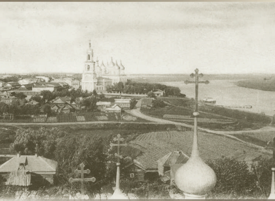
Общий вид. 1910-е гг.

На откосы, Волга, хлынь, Волга, хлынь, Гром, ударь в тесины новые, Крупный град, по стеклам двинь — грянь и двинь,— А в Москве ты, чернобровая, Выше голову закинь.