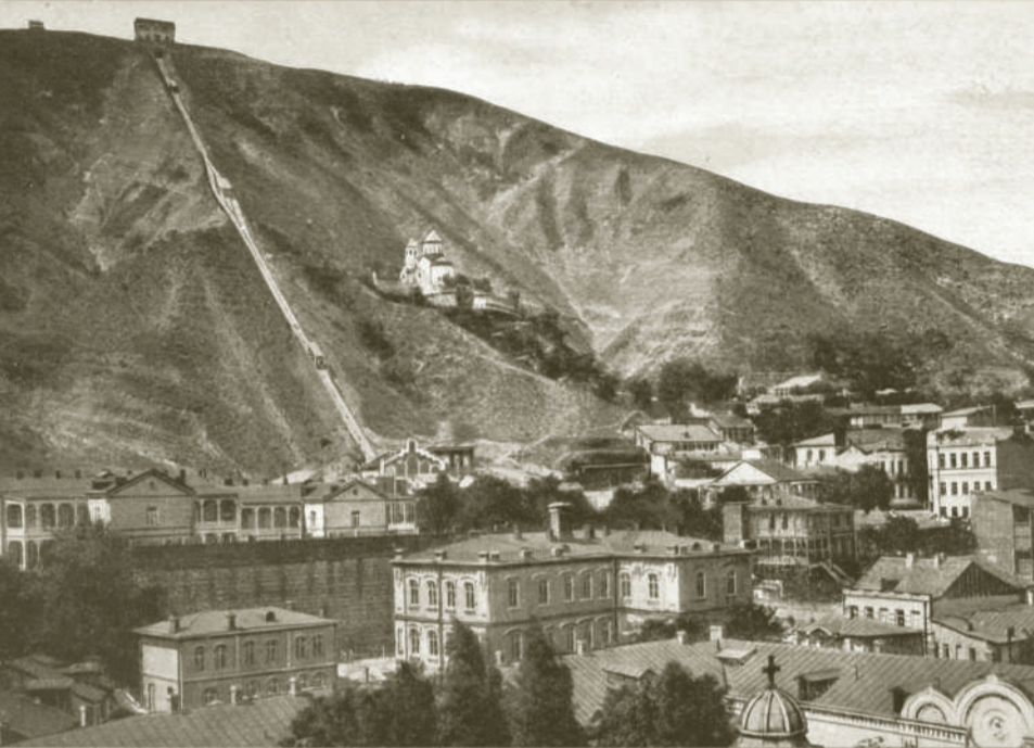
Вид на Мтацминду, монастырь Св. Давида и фуникулер.

Еще он помнит башмаков износ — Моих подметок стертое величье, А я — его: как он разноголос, Черноволос, с Давид-горой гранича.