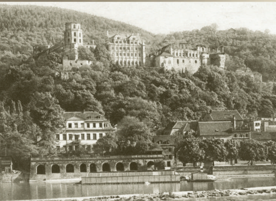
Вид на замок. 1910-е гг.

Ни о чем не нужно говорить, Ничему не следует учить,