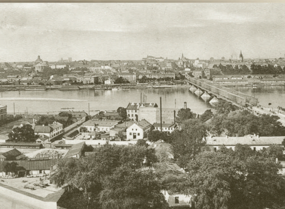
Общий вид. 1910-е гг.