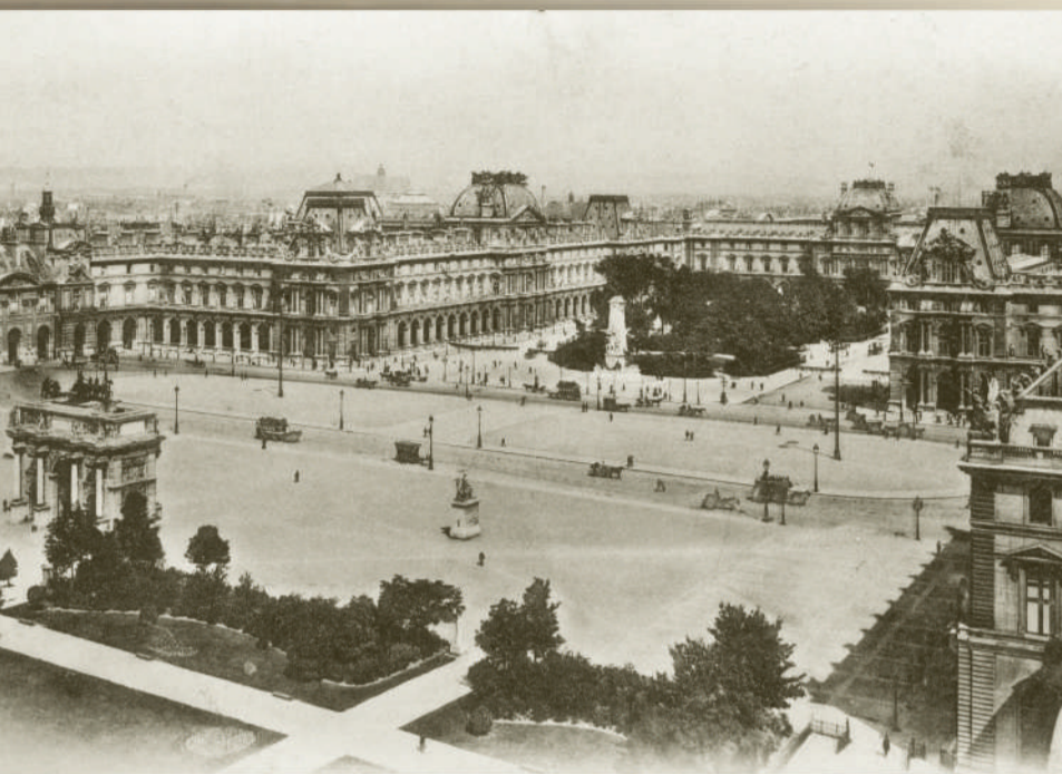
Лувр. 1910-е гг.