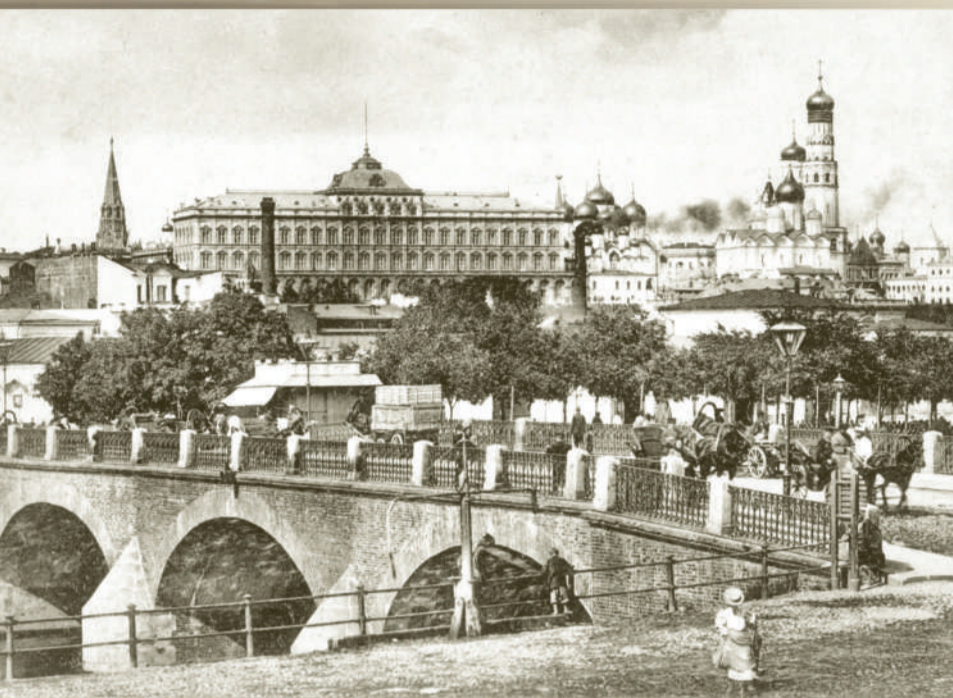
Вид на Кремль от Болотного острова.

В разноголосице девического хора Все церкви нежные поют на голос свой, И в дугах каменных Успенского собора Мне брови чудятся высокие, дугой.