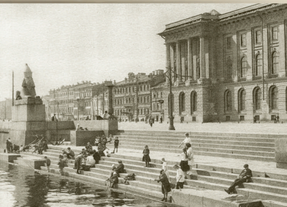
Набережная Невы. 1930

Я вернулся в мой город, знакомый до слез, До прожилок, до детских припухлых желез.