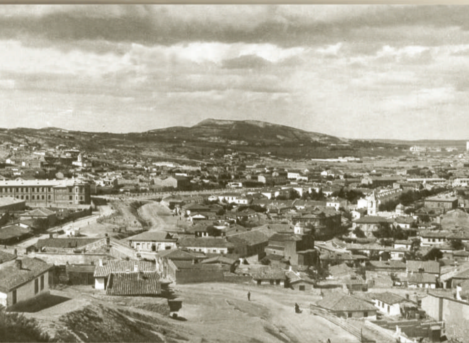
Общий вид. 1910-е гг.